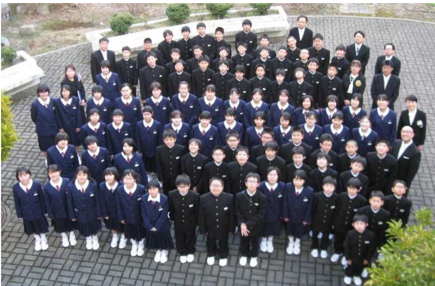
入学式後 中庭で 1学年

新年度が始まってから大きな事故やトラブルもなく、「いいスタート」が切れたと感じています。新入生が緊張の中にも、頑張ろうとしている姿や上級生が優しく親切に接している姿が、現在の荒川中学校の良さだと思います。このようにこれからも、落ち着いた学校生活を生徒の皆さんと一緒に創っていきたいと思います。ご協力をお願いします。