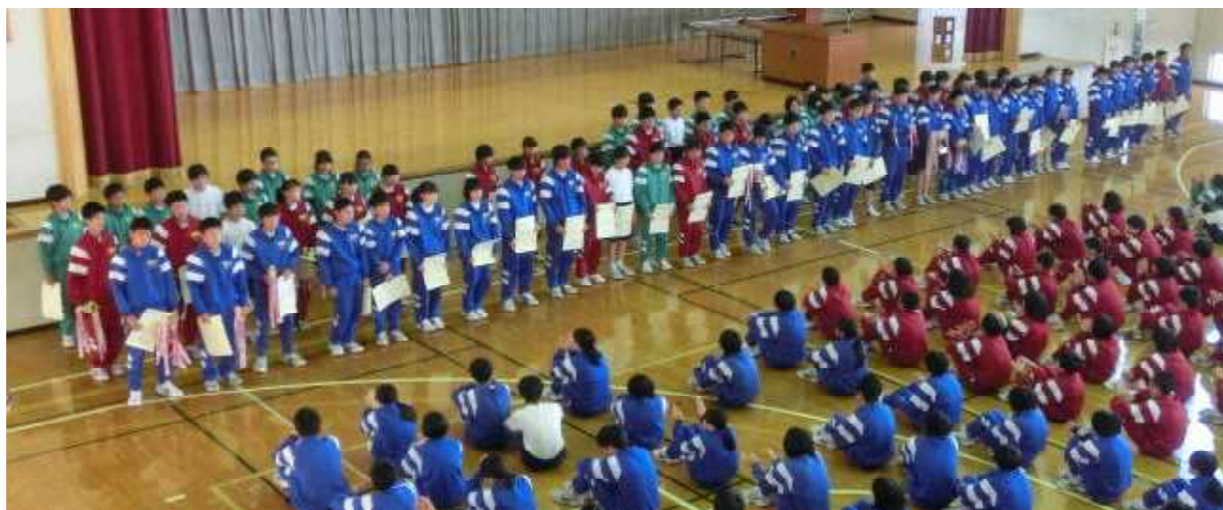
昨年より1つ多い16個の優勝カップ・トロフィー

○1年生によるラベンダー花壇除草作業【5/16(火)午後グリーンパーク・あらかわ】